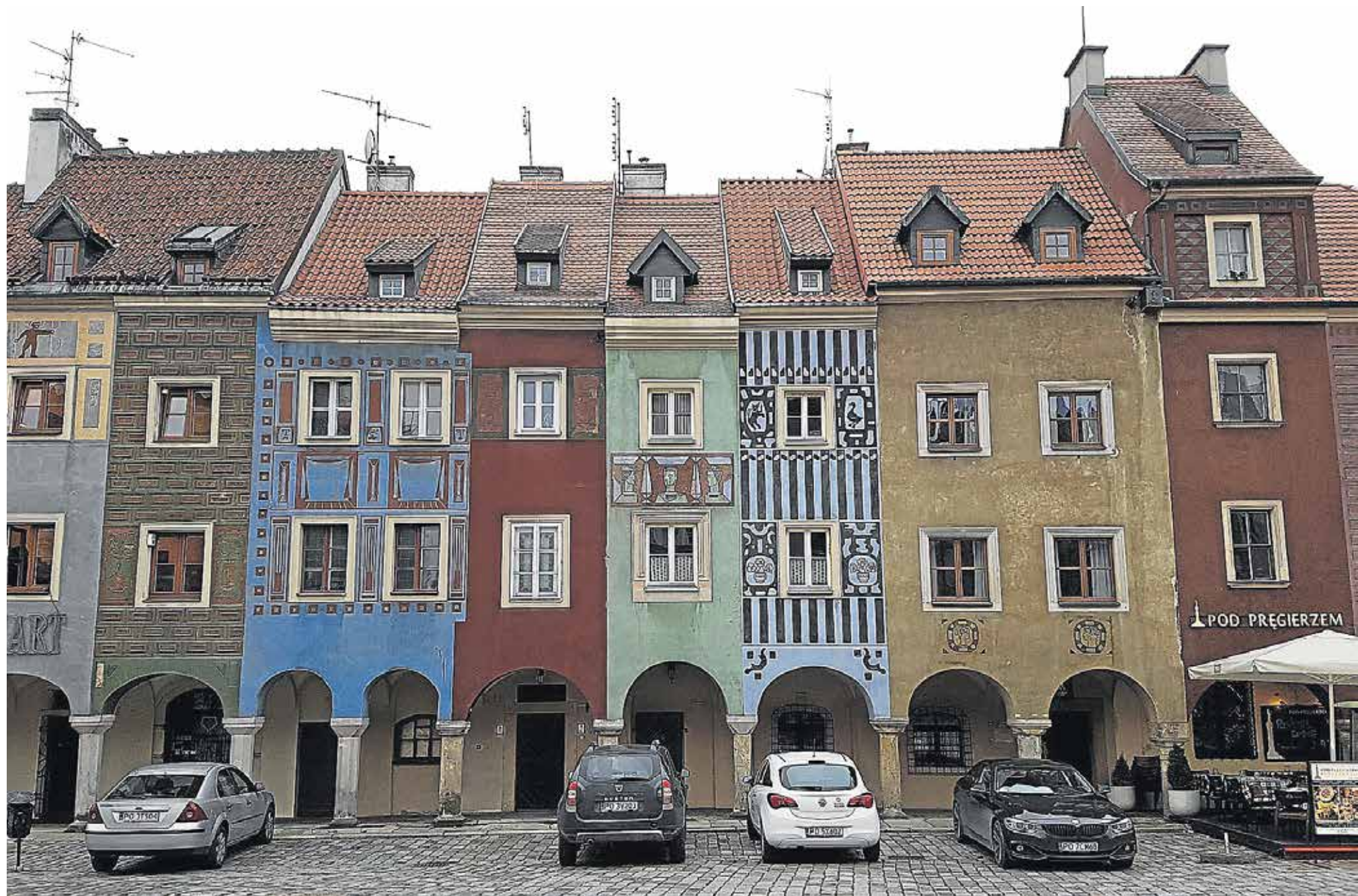
Der ligger mange gavlhuse i byens centrum, og flere af lejlighederne er i dag bygget sammen med nabohuset.