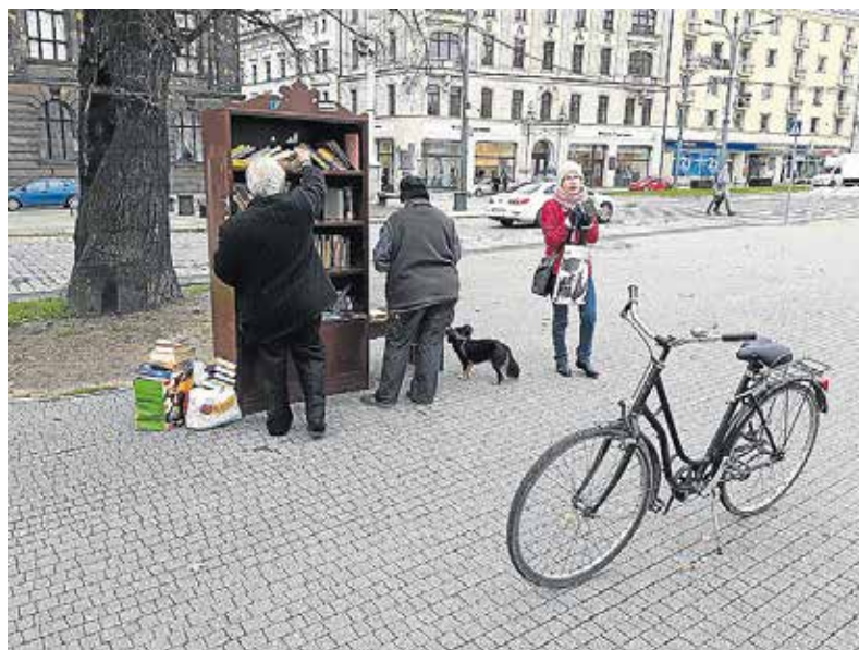
Flere steder i byen møder man bibliotekske, hvor borgerne bytter bøger.