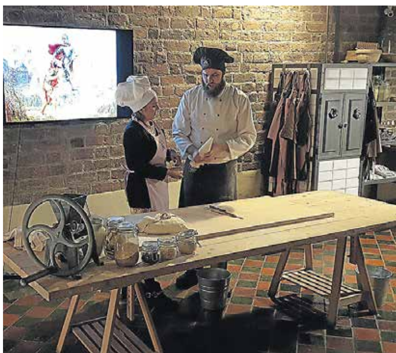
På Rogalowe Muzeum Poznania stifter de besøgende bekendtskab med de velsmagende Saint Martin Croissants, som de også selv får lov til at bage.

gamle jødiske gade Zydowska. Udefra kan de se jævne ud, men går man ind - og det bør man gøre - opdager man et eksotisk mekka af