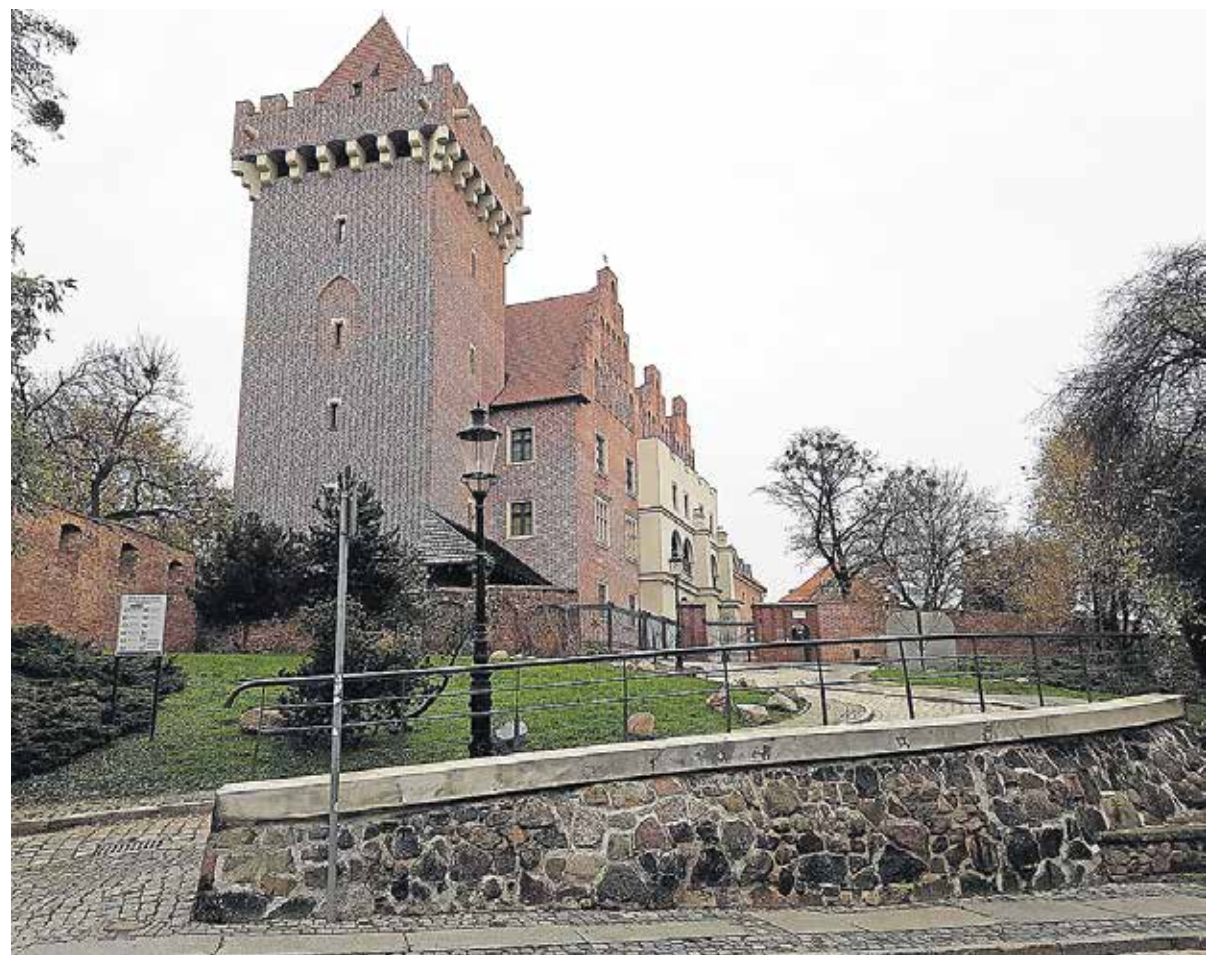
Slottet er ikke så gammelt, som stilen antyder.

blomsterpyntede gårdhaver efter italiensk og spansk inspiration. Det er helt forryllende, så meget mange cafe-ejere gør ud af de-