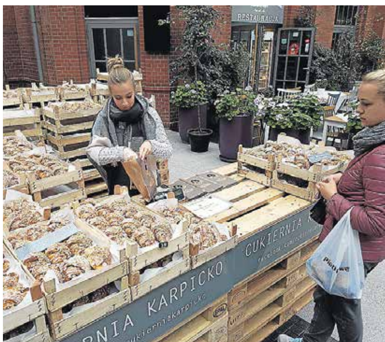
Kun personer med originalt certifikat har lov til at bage og sælge Saint Martin Croissants.

Den gamle bydel er mere end Rynek. Gå på opdagelse i sidegaderne, og du finder et middelalderslot under genopbygning og den smukkeste rød-hvidebarokkirke og kloster, Fara Poznanska. Se kirken in-