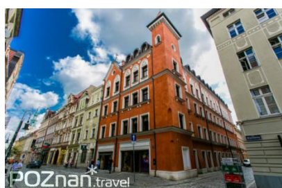
Hotel Palazzo Rosso***