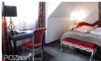
City Solei Boutique Hotel ****

Jeśli chcesz nocować blisko serca Starego Miasta, skorzystaj z noclegu w jednym z proponowanych poniżej hoteli.