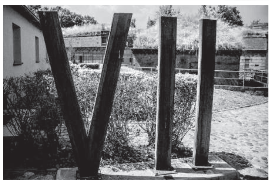
In 1939 namen de nazi's Fort VII in bezit en vormden het om tot concentratiekamp. Ze fusilleerden er onder anderen hoogopgeleide Polen uit de regio Wielkopolska.