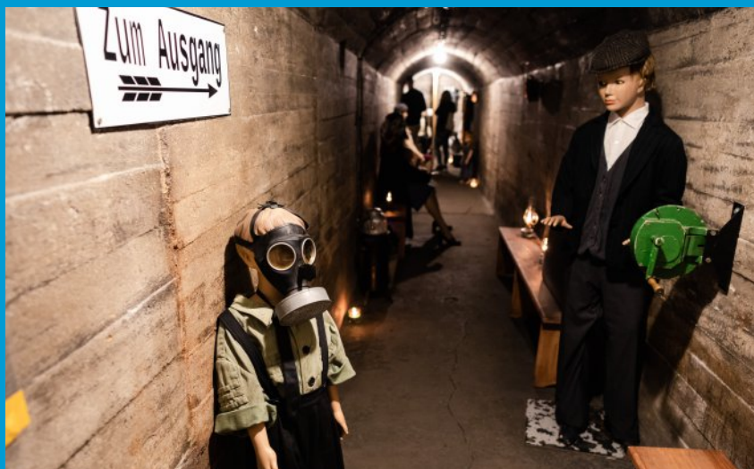
Schron Pasjonatów Podziemi, czyli szczelina przeciwlotnicza (Luftschutz) z okresu II wojny światowej