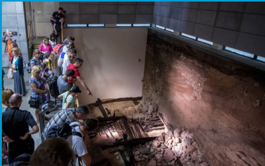
Relikty wałów średniowiecznego grodu z czasów Mieszka I (X w.) w Rezerwacie Archeologicznym Genius loci