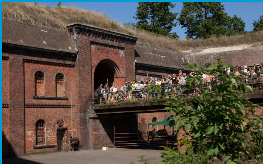
Fort VI (1879–1883) – przykład jednego z 9 fortów głównych poznańskiej twierdzy fortowej